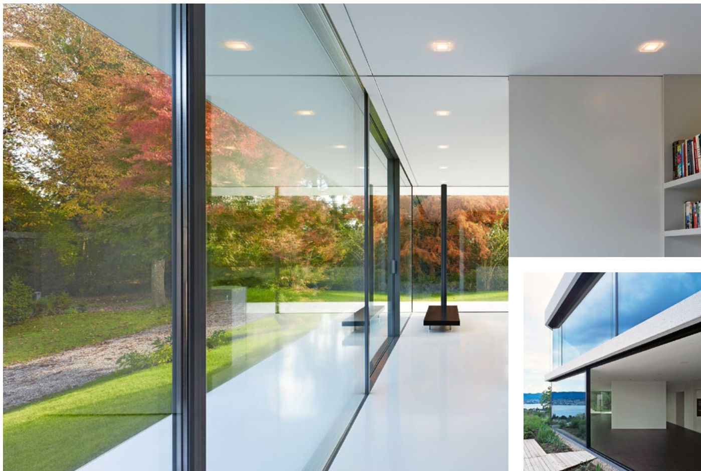
air-lux ist das boden- und deckenbündige Glasfassadensystem, ästhetisch, technisch und funktional.

Alles begann mit viel Pioniergeist und einer bahnbrechenden Idee: der Produktion von minimalistischen und übergrossen Schiebefenstern, welche gleichzeitig zu 100 % dicht sind.