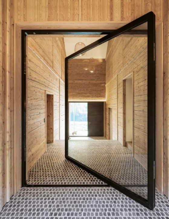
Die Pivottüre, eine faszinierende Lösung für grosse Eingangsbereiche. Auch sie mit patentierter Luftdichtung von air-lux.